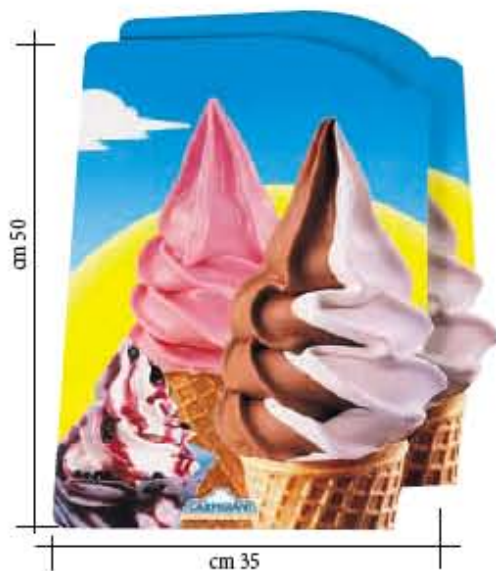
Doppelseitige Roters Softeis

Code-Nr. 757900078 - cm. 35 x 50 h aus haftendem PVC, zum Anbringen an den Vitrinen, um die Passanten zum Verzehr Ihres Eises zu verlocken.