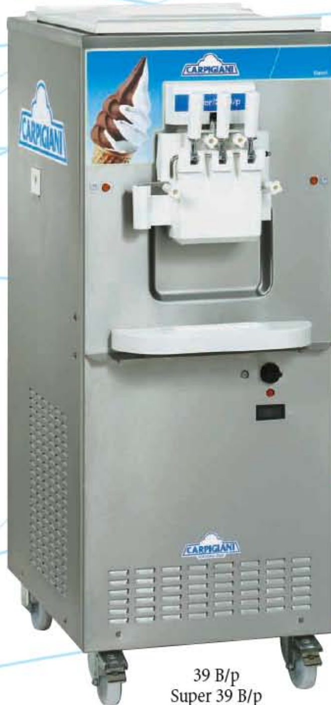
39 B/p Super 39 B/p