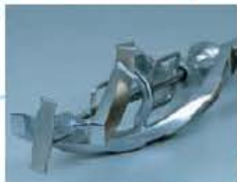
- R-Pumpe - 2E Rührwerk für hohen Volumenaufschlag