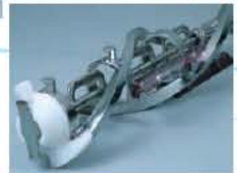
- R Pumpe - 3X-Rührwerk für hohen Volumenaufschlag