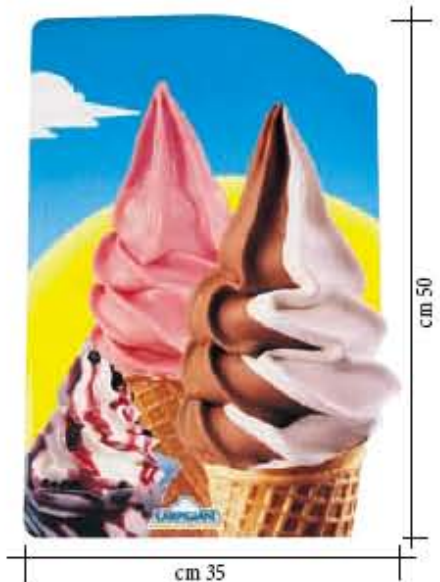
Doppelseitige Glasaukleber Softeis