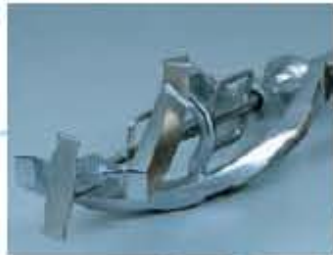
- R-Pumpe - 2E Rührwerk für hohen Volumenaufschlag